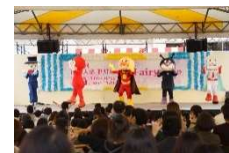
アンパンマンショー