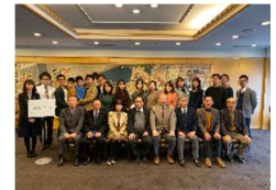
5期生卒業10周年パーティ